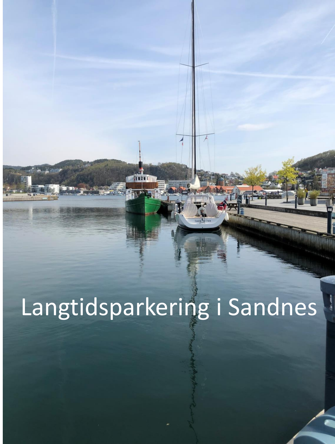
Langtidsparkering i Sandnes